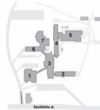
VGU SAULĖTEKIO RŪMAI, SAULĖTEKIO AL. 11

VGU fakultetai išsidėstę įvairiose Vilniaus dalyse, o pagrindiniai rūmai yra įsikūrę Saulėtekio al. 11. Jei į universitetą planuojate vykti viešuoju transportu, suplanuoti kelionę, pasitikrinti troleibusų ir autobusų tvarkaraščius gali www.vilniustransport.lt